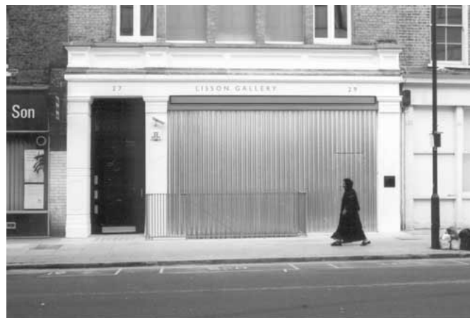
Santiago Sierra. Space closed off by corrugated metal. 2002

En estas propuestas –sólo citadas a título de referencia entre tantas otras- y aún riesgo de parecer un contrasentido, no se propone nada. O mejor dicho, no se propone nada más ni nada menos que eso: un espacio vacío o cerrado en el que no hay nada para ver. Frustración de la mirada. El elemento escópico -hasta ahora esencial en la producción artística- ha sido puesto en jaque.