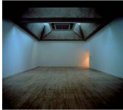
Martin Creed. The lights Going On and Off. 2001