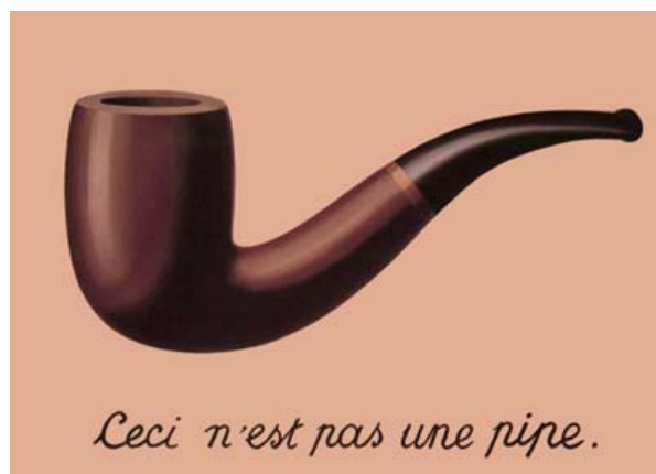
René Magritte. La traición de las imágenes. Esto no es una pipa . 1928-29